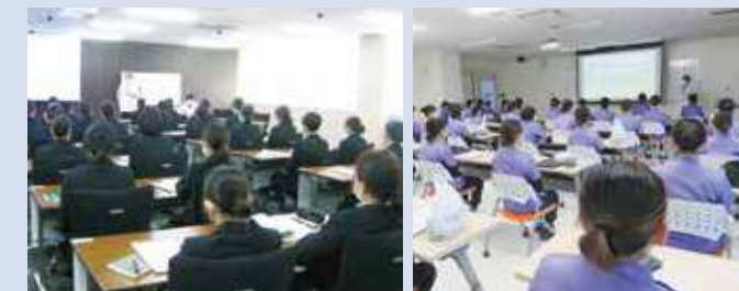
広島大学病院臨地実習

大学病院・総合病院では、一般歯科医院ではめったに触れる事の出来ない症例に触れることが出来ます。また、広島・岡山大学病院で、チーム診療、他機関との連携で行われる歯科治療など様々なケースを経験します。さらに、大学病院は研究機関としての役割を担っており最先端や未来の歯科医療を現場で体験したり、見学することが出来ます。本校は、大学病院との密接な連携により実習を行います。