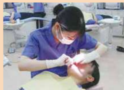
歯科診療補助実習

専門分野は、臨床歯科医学と口腔保健学とに大別されます。臨床歯科医学は、歯科の医療現場で実際行われている様々な症例について学びます。また、歯科衛生士としての重要な役割である 歯科診療補助 、 歯科予防処置 もここで、学びます。口腔保健学は、口腔の健康増進に対する取り組みを学びます。歯科保健指導もここで学びます。その他、近年ますます必要とされてきている介護技術、医療保険事務なども学びます。