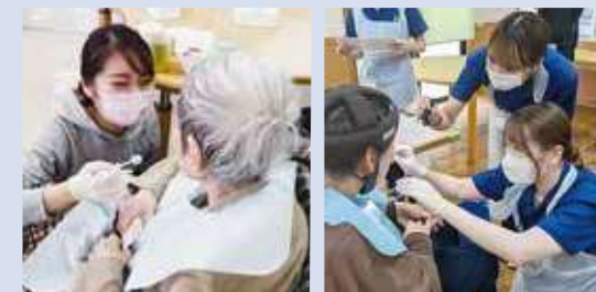
障がい者施設実習

障がい者の診療には、それぞれの人の持つ障害に対し知識と配慮を必要とされます。歯科衛生士は障害を抱える人が安心して治療を受けられるために非常に大きな役割を担います。本校では、併設の口腔保健センターでの診療を通しての実習と障がい者施設での口腔衛生への取り組みとブラッシング実習を通して豊かな配慮のできるボランティア精神を育みます。